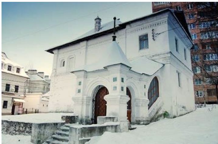
Фото 2025 г.