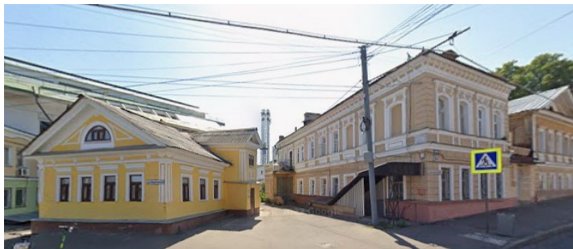
Фото 2021 г.