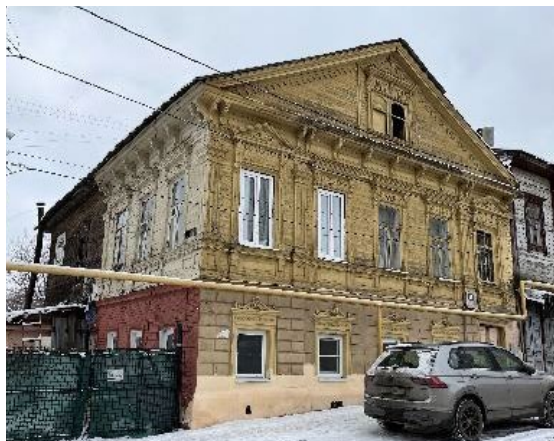
Фото 2025 г.