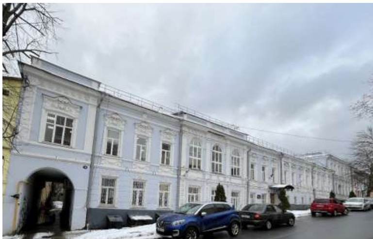
Фото 2025 г.