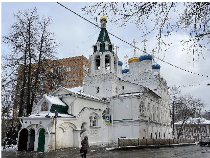
Фото 2025 г.