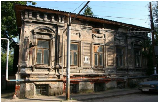
Фото начала ХХI в.