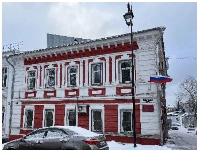
Фото 2025 г.